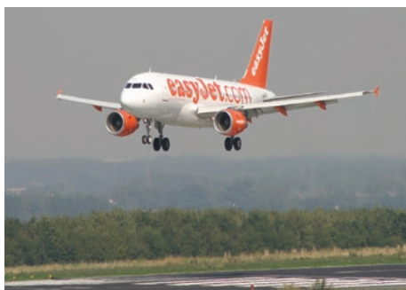
Das Dortmunder Schallschutzprogramm hilft der Umwelt und den Nachbarn.

Mit seinem Schallschutzprogramm hat der Dortmunder Flughafen die gesetzlichen Auflagen schon frühzeitig mehr als erfüllt. Das Schallschutzgebiet rund um den Flughafen wurde deutlich größer ausgewiesen, als es das Gesetz gegen den Fluglärm zum damaligen Zeitpunkt vorsah. Die Kosten für bauliche Schallschutzmaßnahmen werden in der Regel voll von der Flughafengesellschaft übernommen – auch hier geht der Flughafen über das erforderliche Maß hinaus. Jene Maßnahmen sorgen dafür, dass durch An- und Abflüge in den Innenräumen bei geschlossenen Fenstern keine höheren Einzelschallpegel als 55 Dezibel (dB(A)) auftreten. Dieser Wert entspricht in etwa der Lautstärke einer normal geführten Unterhaltung. Anspruchsberechtigt sind derzeit 280 Immobilienbesitzer in Unna, Holzwickede und Dortmund. Ergänzt wird das Programm durch regelmäßige Lärmmessungen rund um den Flughafen.